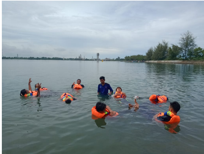
KSR-PMI Unit 04 Universitas Malikussaleh menggelar Pradik live praktik SAR di Laut.