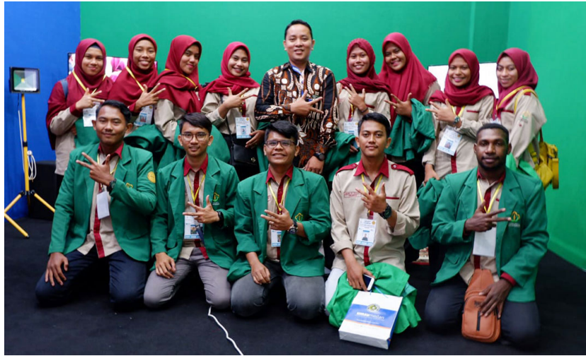
Mahasiswa Prodi Ilmu Komunikasi Universitas Malikussaleh mengunjungi sejumlah media massa dan perkantoran di Medan, Sumatera Utara, 2-5 Desember 2019.