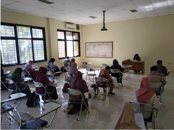
Suasana Ujian Seleksi tahap I Kompetisi Nasional Matematika dan Ilmu Pengetahuan Alam (KN MIPA) di Universitas Malikussaleh, Sabtu (14/3/2020). FOTO