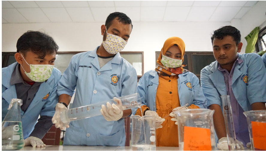
Proses pembuatan hand sanitizer di Laboratorium Teknik Kimia Fakultas Teknik Universitas Malikussaleh, Kamis (19/3/2020).