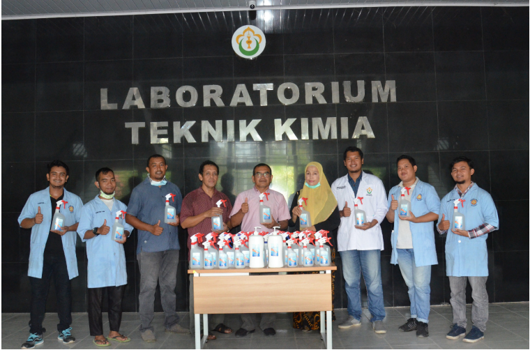
Mahasiswa Prodi Teknik Kimia Fakultas Teknik Universitas Malikussaleh produksi hand sanitizer.