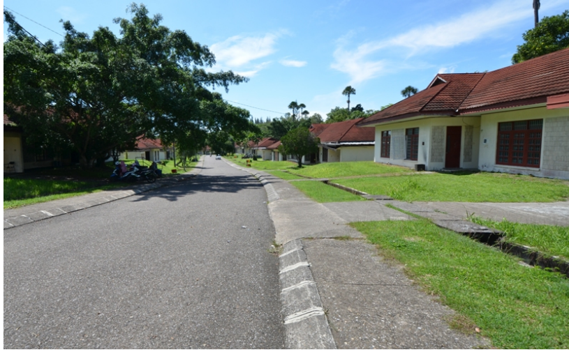
Jalan menuju FISIP Unimal, Kampus Bukit Indah Lhokseumawe.