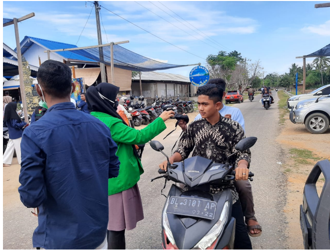
Mahasiswa KKN Universitas Malikusaleh bagikan masker kepada masyarakat di Kota Pantan Labu.