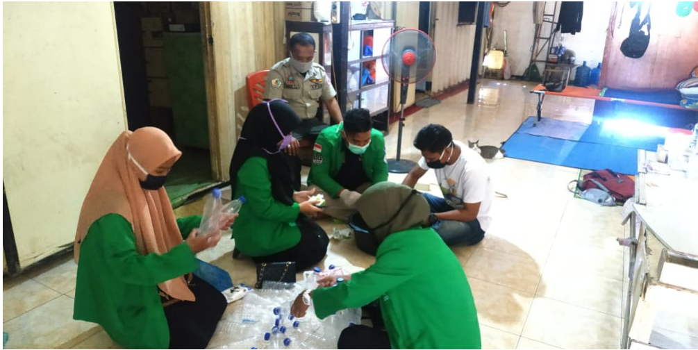
Mahasiswa Universitas Malikussaleh produksi sabun cair di posko Covid 19 Kantor BPBD Kabupaten Aceh Utara.