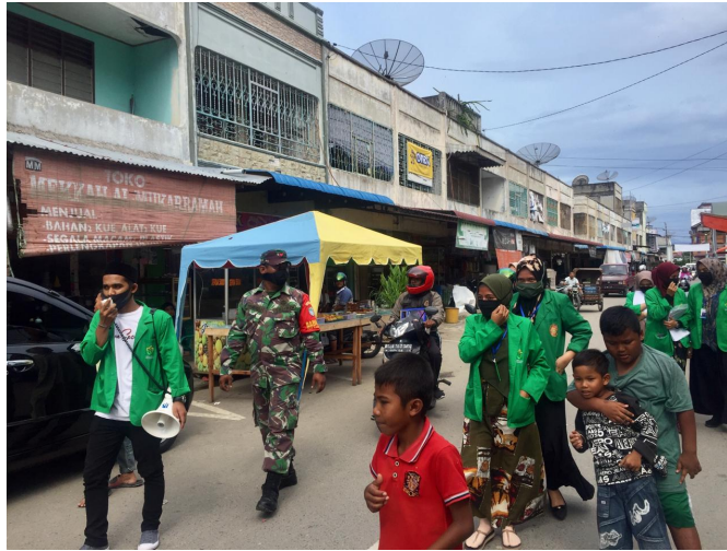
Mahasiswa KKN kelompok 152 Universitas Malikussaleh melakukan sosialisasi pencegahan Virus Corona kepada masyarakat di Desa Keude Cunda, Kecamatan Muara Dua, Lhokseumawe, (4/5/2020).