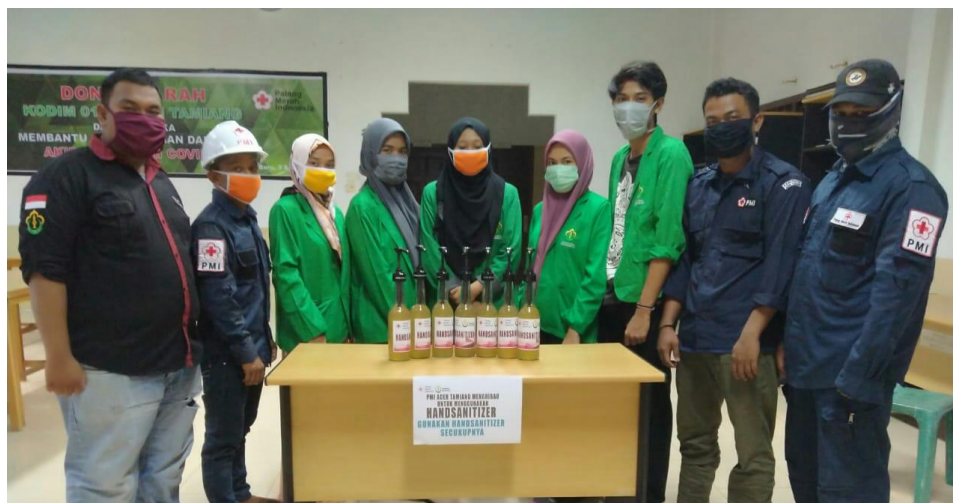
Mahasiswa Universitas Malikussaleh yang sedang melakukan kegiatan KKN bersama Tenaga Suka Rela PMI Aceh Tamiang membuat Hand Sanitizer.