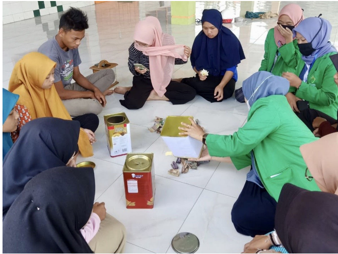
Mahasiswa KKN Kerlompok 183 Universitas Malikussaleh membersihkan Masjid Al Jamiatul Hidayah di Desa Bah Butong 2 Afd 1 Kecamatan Sidamanik Kabupaten Simalungun, Sumatera Utara.