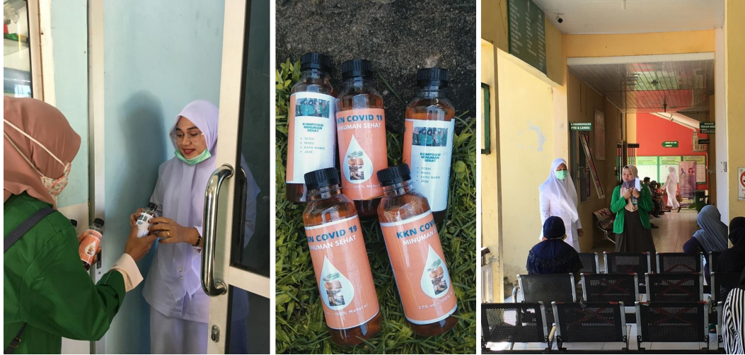
Mahasiswa KKN kelompok 165 Universitas Malikussaleh bagikan minuman sehat sambil melakukan sosialisasi pencegahan Covid-19 kepada pasien di Puskesmas Kecamatan Dewantara, Aceh Utara.