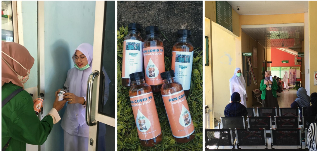
Mahasiswa KKN kelompok 165 Universitas Malikussaleh bagikan minuman sehat sambil melakukan sosialisasi pencegahan Covid-19 kepada pasien di Puskesmas Kecamatan Dewantara, Aceh Utara.