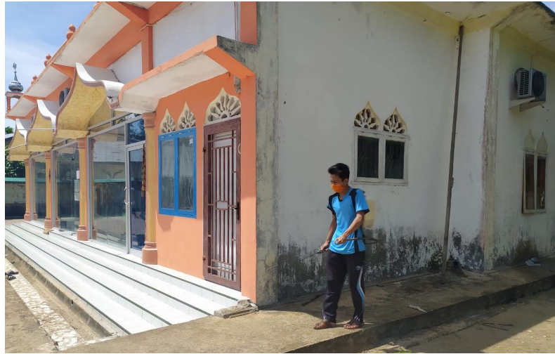
Mahasiswa KKN kelompok 16 Universitas Malikussaleh melakukan penyemprotan disinfektan di area Masjid At Taqwa Gampong Blang Weu Panjoe Kecamatan Blang Mangat, Lhokseumawe.