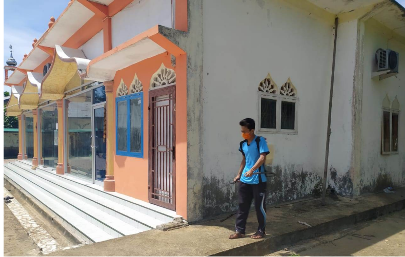
Mahasiswa KKN kelompok 16 Universitas Malikussaleh melakukan penyemprotan disinfektan di area Masjid At Taqwa Gampong Blang Weu Panjoe Kecamatan Blang Mangat, Lhokseumawe.