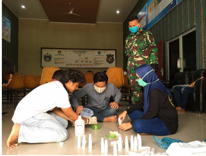
Mahasiswa KKN-BK Buat Hand Sanitizer dan Dibagikan Kepada Masyarakat di Kota Medan.