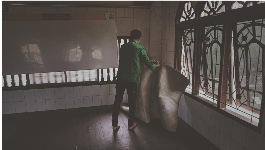
Mahasiswa KKN di Desa Bayu Bersihkan Meunasah dan Tempat Wudhu.