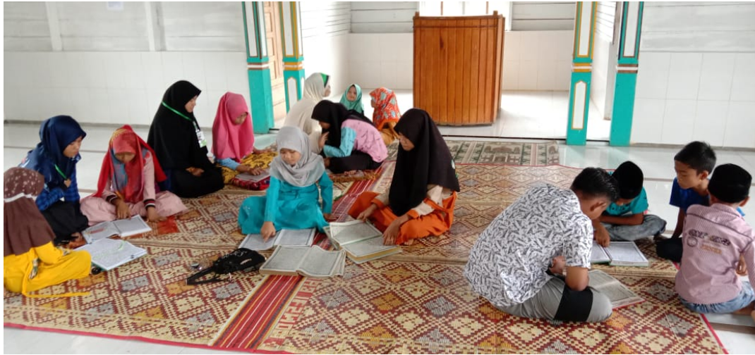
Mahasiswa KKN-BK Universitas Malikussaleh melaksanakan kegiatan pengajian.