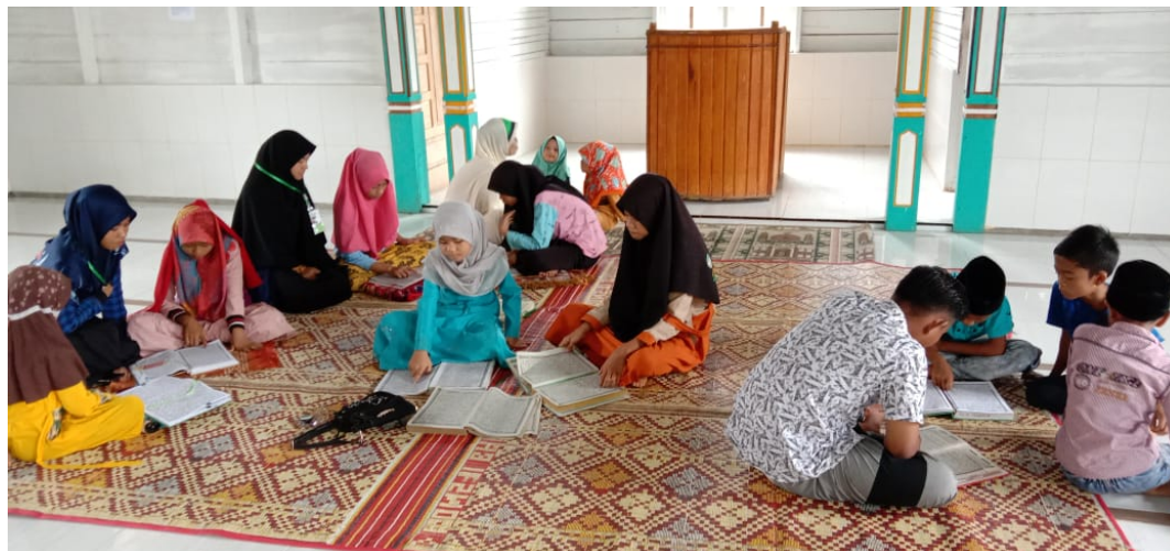
Mahasiswa KKN-BK Universitas Malikussaleh melaksanakan kegiatan pengajian.