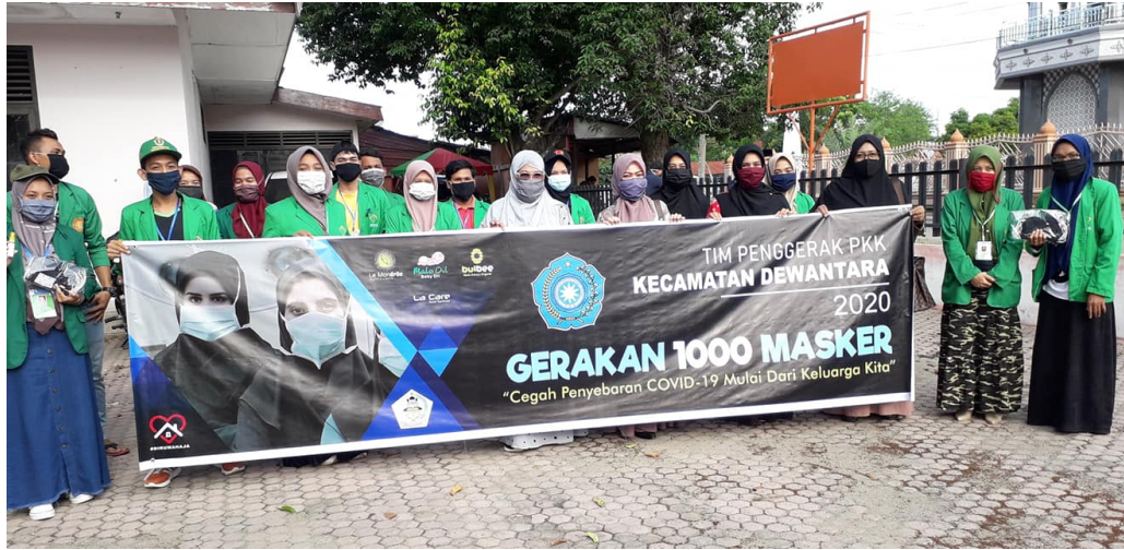
Mahasiswa KKN kelompok 164 dan 165 Universitas Malikussaleh .