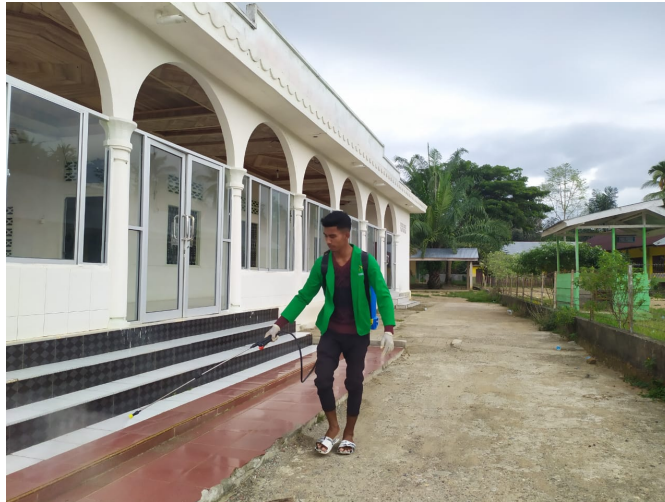
Mahasiswa KKN di Desa Blang Riek Lakukan Penyemprotan Disinfektan di Tempat Umum.