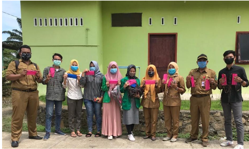
Mahasiswa KKN Universitas Malikussaleh bagikan masker kepada masyarakat.