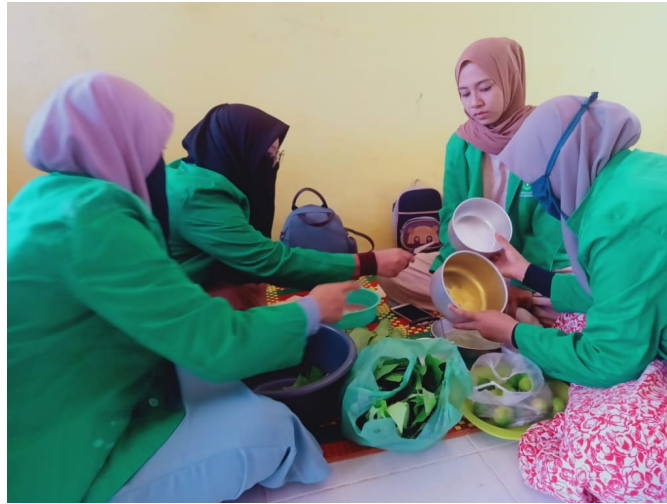
Mahasiswa KKN Unimal buat hand sanitizer dari bahan alami.