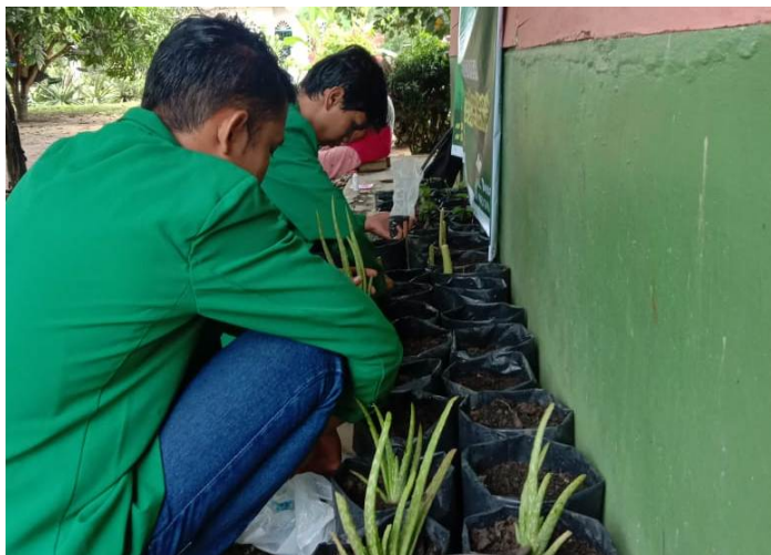
Mahasiswa KKN-BK Kelompok 185 Universitas Malikussaleh melakukan pembuatan apotek hidup dan taman gizi perkarangan di Desa Sekoci.