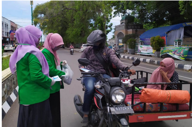
Mahasiswa KKN Universitas Malikussaleh yang tergabung dalam Kelompok 48 membuat masker di Posko Gugus Tugas Percepatan Penanggulangan Covid-19 Komplek Meligoe Bupati Bireuen.