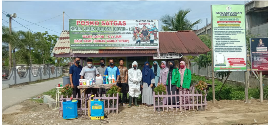
Mahasiswa Unimal kelompok 187 yang melaksanakan KKN di Desa Alue Barueh, Kecamatan Seunuddon, Kabupaten Aceh Utara melakukan penyemprotan disinfektan.