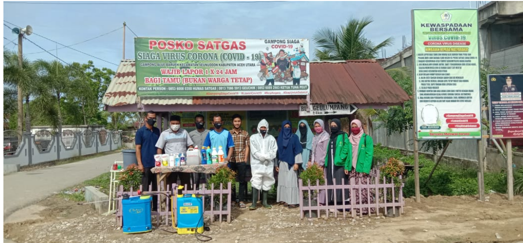
Mahasiswa Unimal kelompok 187 yang melaksanakan KKN di Desa Alue Barueh, Kecamatan Seunuddon, Kabupaten Aceh Utara melakukan penyemprotan disinfektan.