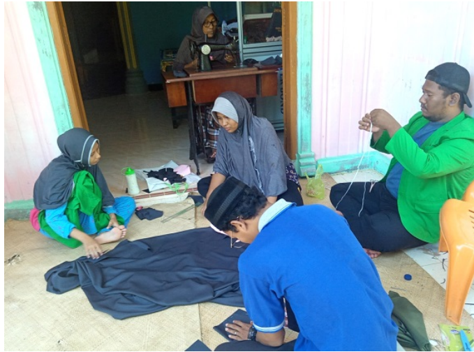
Mahasiswa Universitas Malikussaleh yang melaksanakan Kuliah Kerja Nyata Balik Kampung (KKN-BK) Kelompok 54 di Gampong Paya Gaboh, Kecamatan Sawang, Kabupaten Aceh Utara, memproduksi masker bersama warga setempat.