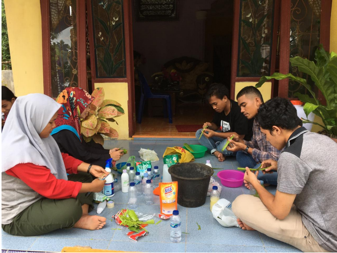
Mahasiswa KKN-BK Kelompok 177 Universitas Malikussaleh meracik hand sanitizer dan disinfektan sekaligus membagikan kepada masyarakat Desa Gunung Kelambu Kecamatan Badiri Kabupaten Tapanuli Tengah.