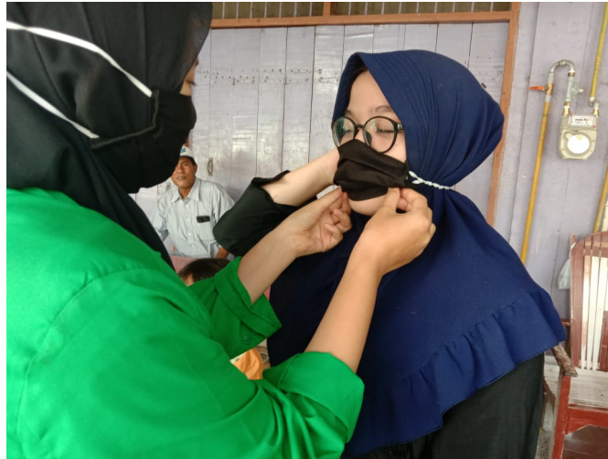
Mahasiswa KKN kelompok 164 Universitas Malikussaleh yang bertugas di Dusun BTN Arun Desa Paloh Lada bagikan masker hasil buatan sendiri kepada masyarakat.