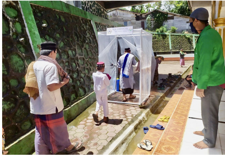
Mahasiswa KKN Kelompok 118 membangun ruang sterilisasi di masjid Desa Blang Rakal Kecamatan Pintu Rime Gayo Kabupaten Bener Meriah, Aceh, Jumat, 10 Juli 2020.