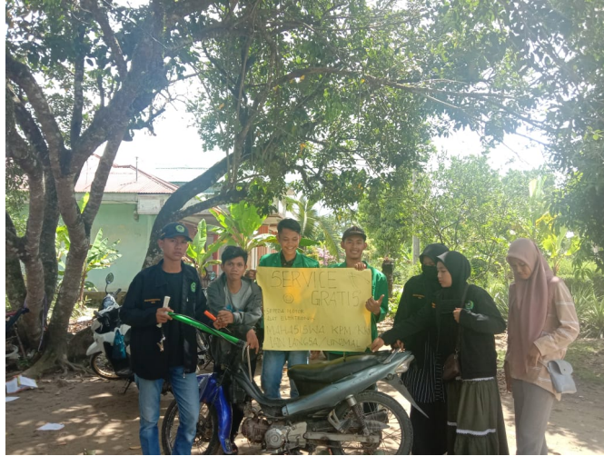
Mahasiswa KKN-BK Universitas Malikussaleh membuka jasa perbaikan kendaraan sepeda motor gratis di Desa Sekoci.