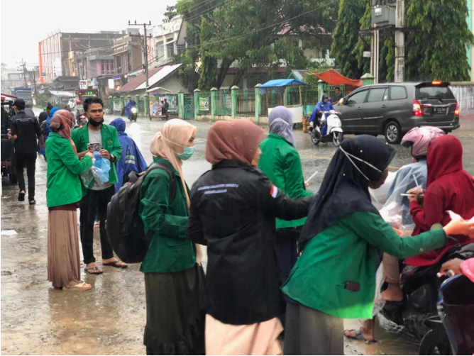
Mahasiswa Unimal bersama tim relawan MRI dan ACT bagikan takjil dan masker gratis kepada warga.