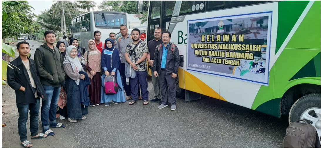
Rektor Universitas Malikussaleh bersama tim relawan penanganan bencana banjir bandang Kabupaten Aceh Tengah, Sabtu 9/16/5/2020).