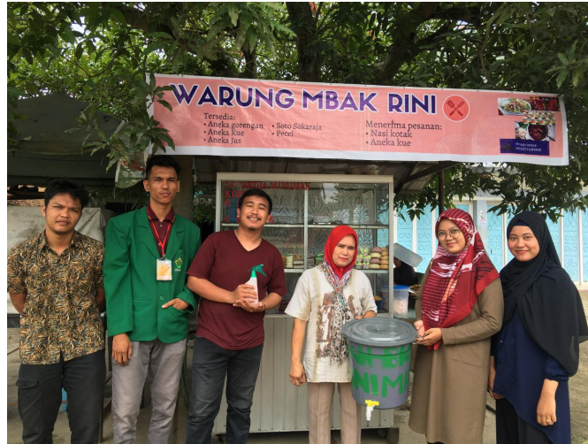
Mahasiswa KKN Universitas Malikussaleh membuat alat pencuci tangan untuk dibagikan kepada masyarakat.