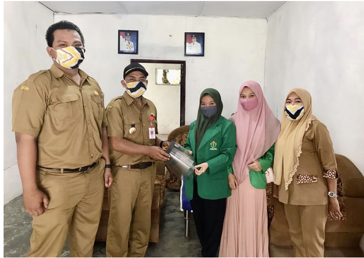
Mahasiswa KKN Kelompok 92 membuat dan membagikan topeng anti-Corona kepada panitia penerimaan zakat di Kelurahan Mayang, Kecamatan Bosar Mali Kabupaten Simalungun, Sumatera Utara.