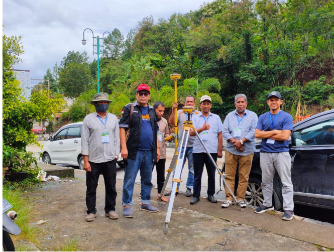
Tim Relawan Jurusan Teknik Sipil Universitas Malikussaleh di Paya Tumpi Kabupaten Aceh Tengah, Minggu (17/5/2020).