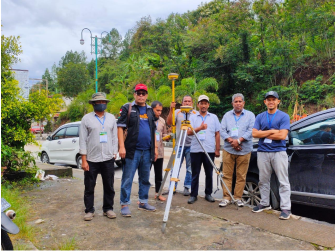
Tim Relawan Jurusan Teknik Sipil Universitas Malikussaleh di Paya Tumpi Kabupaten Aceh Tengah, Minggu (17/5/2020).