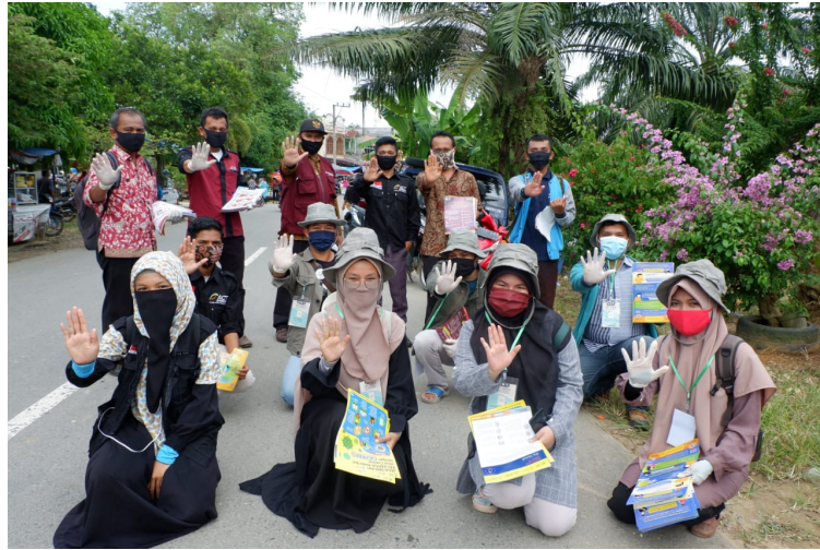
Mahasiswa KKN Universitas Malikussaleh Kelompok 85 bergabung dengan Gerakan Bersama Melawan Covid-19 Kabupaten Aceh Tamiang.