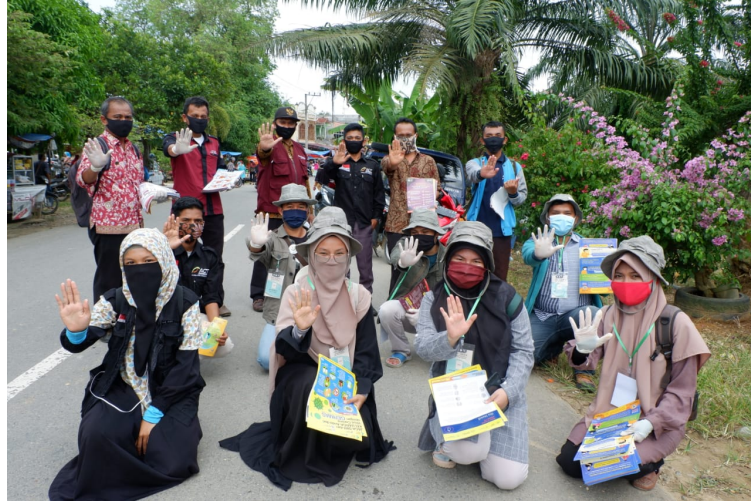
Mahasiswa KKN Universitas Malikussaleh Kelompok 85 bergabung dengan Gerakan Bersama Melawan Covid-19 Kabupaten Aceh Tamiang.