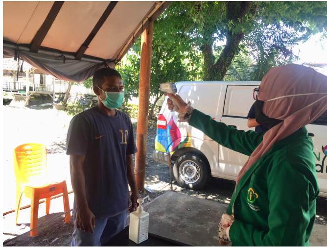
Mahasiswa KKN Universitas Malikussaleh Kelompok 4 cek suhu tubuh warga yang baru pulang dari perantauan.