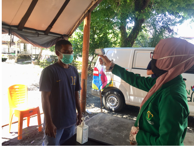
Mahasiswa KKN Universitas Malikussaleh Kelompok 4 cek suhu tubuh warga yang baru pulang dari perantauan.