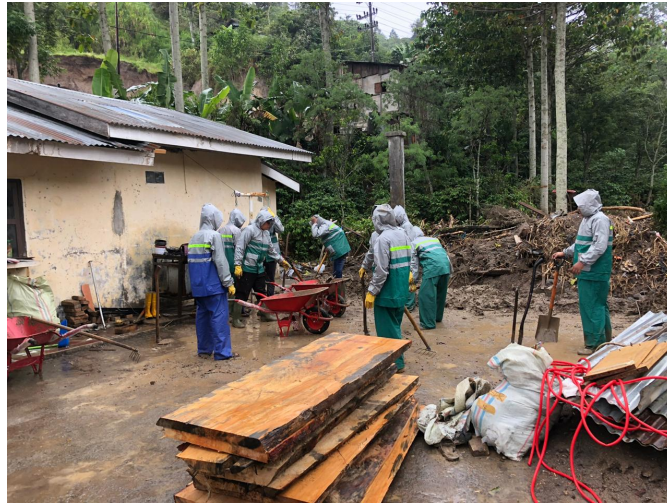
Mahasiswa Universitas Malikussaleh yang menjadi relawan tenaga fisik di lokasi bencana banjir bandang Kabupaten Aceh Tengah, Takengon