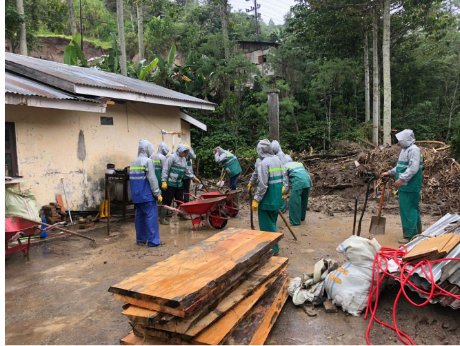
Mahasiswa Universitas Malikussaleh yang menjadi relawan tenaga fisik di lokasi bencana banjir bandang Kabupaten Aceh Tengah, Takengon