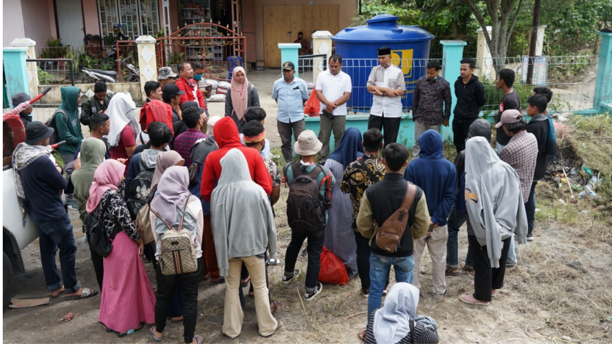
Rektor Universitas Malikussaleh memberikan arahan ketika menjemput para mahasiswa relawan di lokasi bencana.