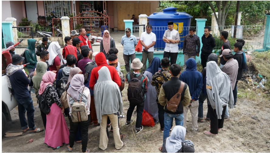
Rektor Universitas Malikussaleh memberikan arahan ketika menjemput para mahasiswa relawan di lokasi bencana.