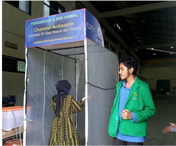
Mahasiswa KKN Kelompok 59 Universitas Malikussaleh membuat alat antisipasi penyebaran virus Corona (Chamber antiseptik).