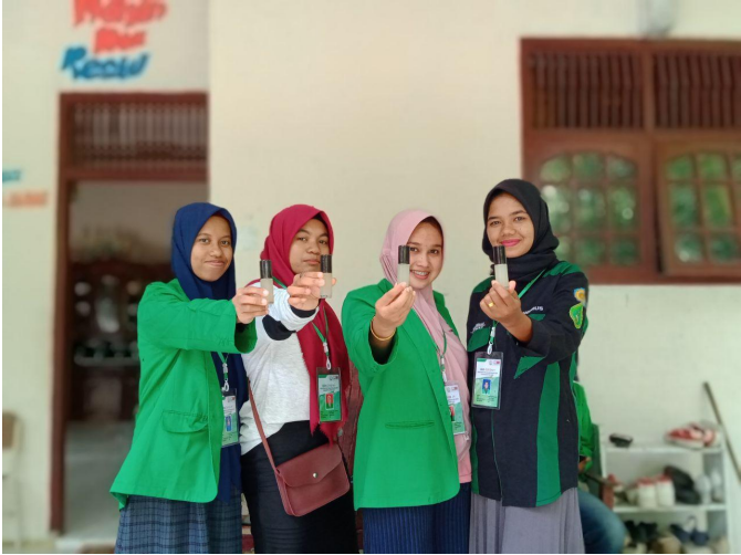
Mahasiswa KKN Kelompok 90 memperlihatkan pembersih tangan yang mereka produksi sedmiring dengan menggunakan bahan alami.