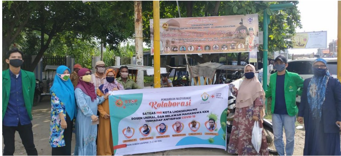
Dosen Fakultas Teknik Universitas Malikussaleh bersama mahasiswa KKN ketika melakukan pengabdian masyarakat beberapa waktu lalu.