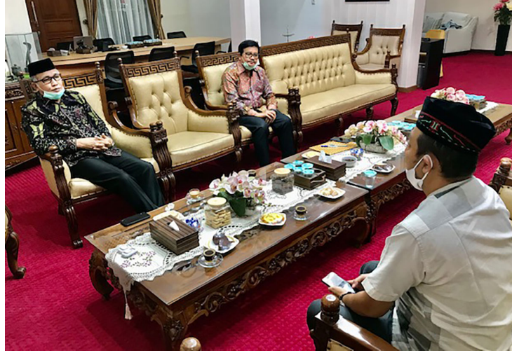
Plt Gubernur Aceh, Nova Iriansyah, didampingi staf ahli Iskandar Jamil, dalam wawancara khusus dengan Unimalnews di Banda Aceh, Rabu (17/6/2020).