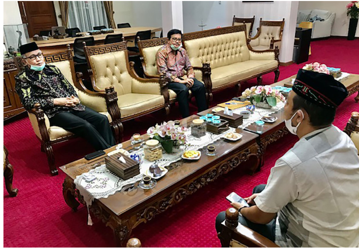
Plt Gubernur Aceh, Nova Iriansyah, didampingi staf ahli Iskandar Jamil, dalam wawancara khusus dengan Unimalnews di Banda Aceh, Rabu (17/6/2020).