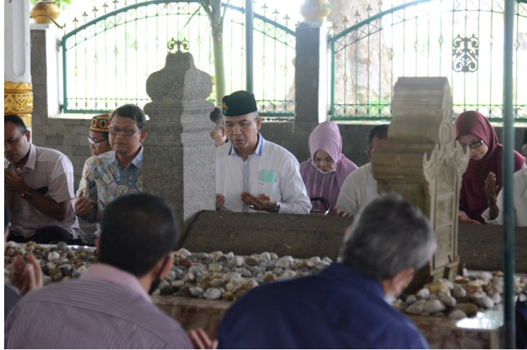
Rektor Universitas Malikussaleh bersama rombongannya ziarah ke makam Sultan Malikussaleh.