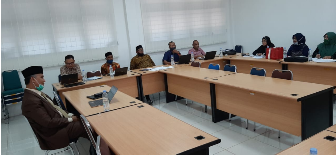
Kepala bagian, Kepala tata usaha, kasubbag dan bendahara penerimaan mengikuti arahan dari Rektor Universitas Malikussaleh, Rabu (1/7/2020).