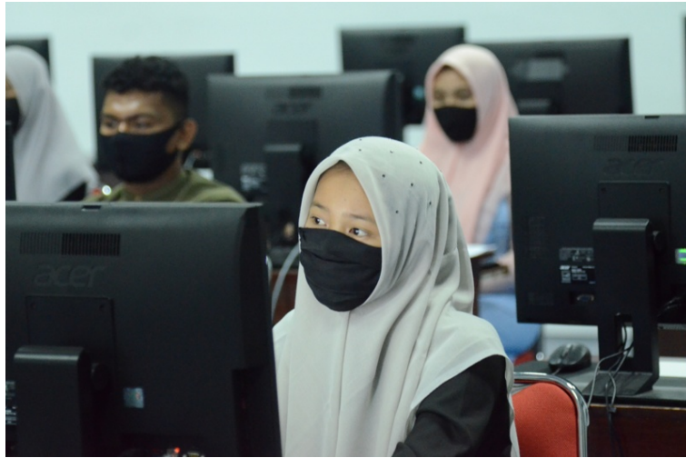
Peserta UTBK-SBMPTN tahun 2020 sedang mengerjakan soal.