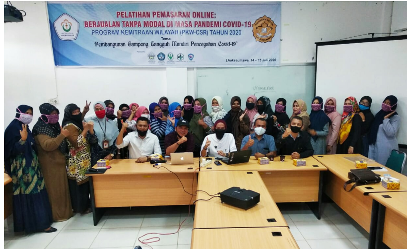
Cetak Pengusaha E-Commerce Handal, PKW-CSR gelar pelatihan pemasaran online.