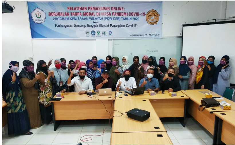
Cetak Pengusaha E-Commerce Handal, PKW-CSR gelar pelatihan pemasaran online.