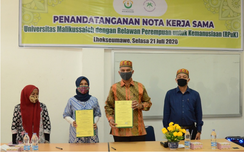
Relawan Perempuan untuk Kemanusiaan Teken MoU kerja sama dengan Unimal.