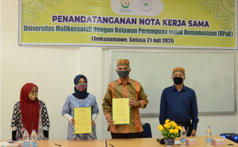
Relawan Perempuan untuk Kemanusiaan Teken MoU kerja sama dengan Unimal.