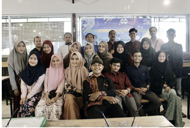
Fokus Grup Diskusi (FGD) Be_Entrepreneur Universitas Malikussaleh di Lhokseumawe, Jumat (17/7/2020).