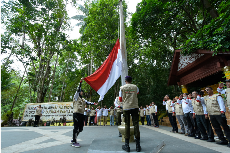
Tim Touring Merdeka Universitas Malikussaleh melakukan pengibaran Bendera Merah Putih di makam Pahlawan Teuku Umar, Aceh Barat (4/8/2020), Foto: Suryadi Kawom