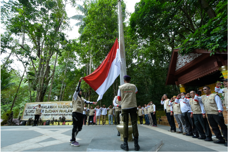
Tim Touring Merdeka Universitas Malikussaleh melakukan pengibaran Bendera Merah Putih di makam Pahlawan Teuku Umar, Aceh Barat (4/8/2020)