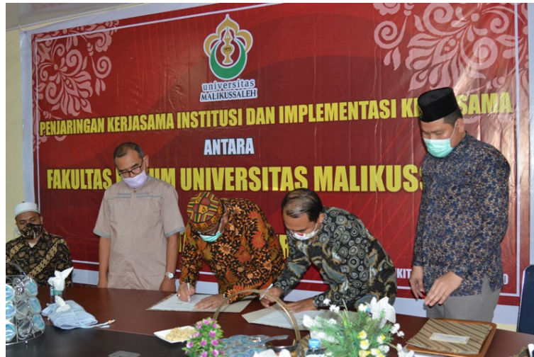
Fakultas Hukum Universitas Malikussaleh memperkuat jaringan dengan menjalin kerjasama dengan sejumlah stakeholder.