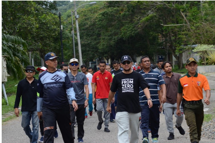
Latihan gerak jalan civitas akademika Universitas Malikussaleh menjelang HUT RI yang Ke-75 di Kampus Bukit Indah Lhokseumawe.